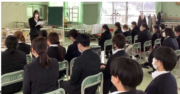
学生会より2年ルーム長にだるまの贈呈

看護師国家試験:2月16日(日)宮城県にて看護専攻科2年生が受験。 看護師国家試験まで33日となりました。 残りの時間を有意義にし、全員合格を目指しましょう(^_-)☆